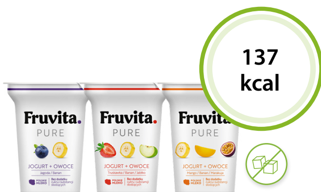
Jogurt Fruvita Pure 137 kcal