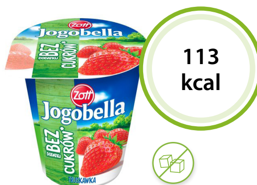
Jogobella truskawkowa bez dodatku cukrów