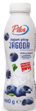
Skyr pitny Pilos