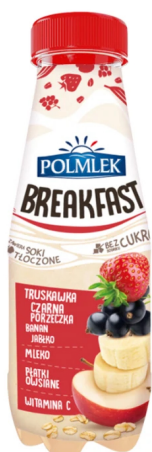
POLMLEK Jogurt Breakfast