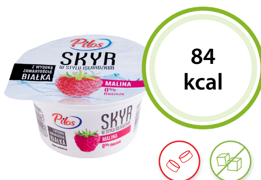
Skyr malinowy Pilos