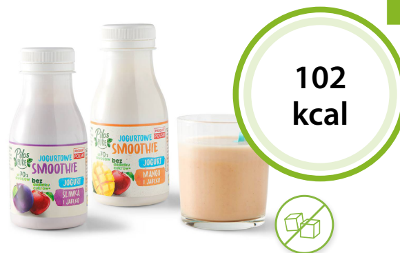
Pilos Pure Jogurtowe smoothie