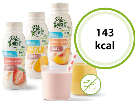
Pilos Pure jogurt pitny