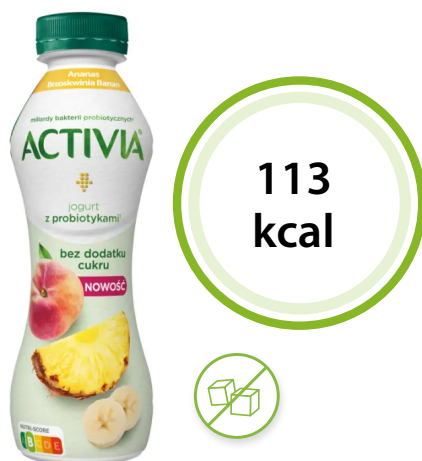
Jogurt Activia ananas, brzoskwinia i banan bez dodatku cukru