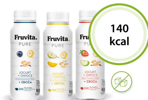
Jogurt Fruvita Pure owoce + zboża